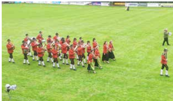
links: Die Musikkapelle bei der Marschmusikbewertung in Raabs an der Thaya. rechts: Für den Musischnaps wurde fleißig Obst gesammelt.

Die „YOUNGSTARS“ bilden 12 Kinder im Alter zwischen 7 und 12 Jahren. Sie hatten am 26. November beim Adventmarkt in Burgschleinitz ihren Auftritt, bei dem sie einige vorweihnachtliche Stücke zum Besten gaben. Ihre nächsten Einsätze werden das „Weihnachtsliederspielen“ im Pfarrhof in Reinprechtspölla (siehe Kasten) und die Kindermette in Burgschleinitz sein.