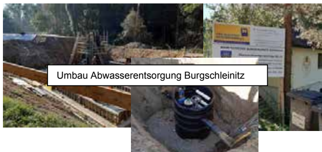
Umbau Abwasserentsorgung Burgschleinitz