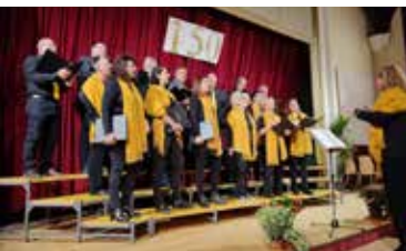
Chöretreffen anlässlich 150 Jahre Stadtchor Eggenburg

Der Klangbogen Reinprechtspölla kann auf ein ereignisreiches Jahr 2022 zurückblicken. Der Chor feierte sein 30-jähriges Bestehen mit einem Konzert am 28. Mai im KUM Burgschleinitz, das gemeinsam mit Marlyn & Stern gestaltet wurde. Wir durften uns außerdem am Bezirksfest in Horn am 26. Juni anlässlich „100 Jahre NÖ“ beteiligen.