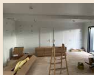
Freiwillige Helfer:innen sorgten dafür, dass das neue Dorfzentrum in Buttendorf zügig Gestalt annahm.