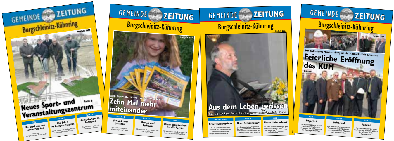
Der Bau des neuen Sport- und Veranstaltungszentrums in Kühnring, die 10. Ausgabe der Gemeindezeitung, das unerwartete Ableben des beliebten Bürgermeisters Gerhard Krell sowie die Eröffnung des KUM in Burgschleinitz – wichtige Ereignisse fanden ihren Platz auf den Titelseiten der Gemeindezeitungen.