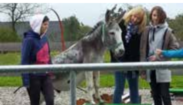
Eselführerschein beim Eselhof Pömling

Am 2. Oktober unternahm der Klangbogen einen gESELLigen Ausflug zum Eselhof Pömling, wo wir nach theoretischer und praktischer Prüfung den Eselführerschein – die Lizenz der Sonderklasse – erhielten. Es war eine tierische Gaudi! Der Stadtchor Eggenburg feierte am 9. Oktober sein 150. Jubiläum mit einem Chöretreffen im Lindenhofsaal. Wir bedanken uns und gratulieren noch einmal herzlich!